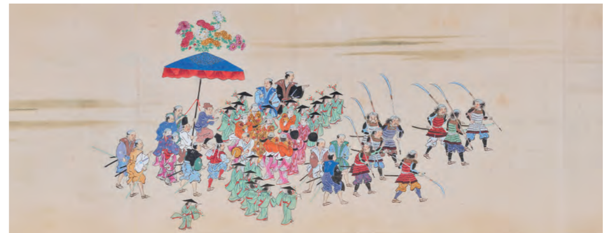
②南の山(五色山)の謡囃子