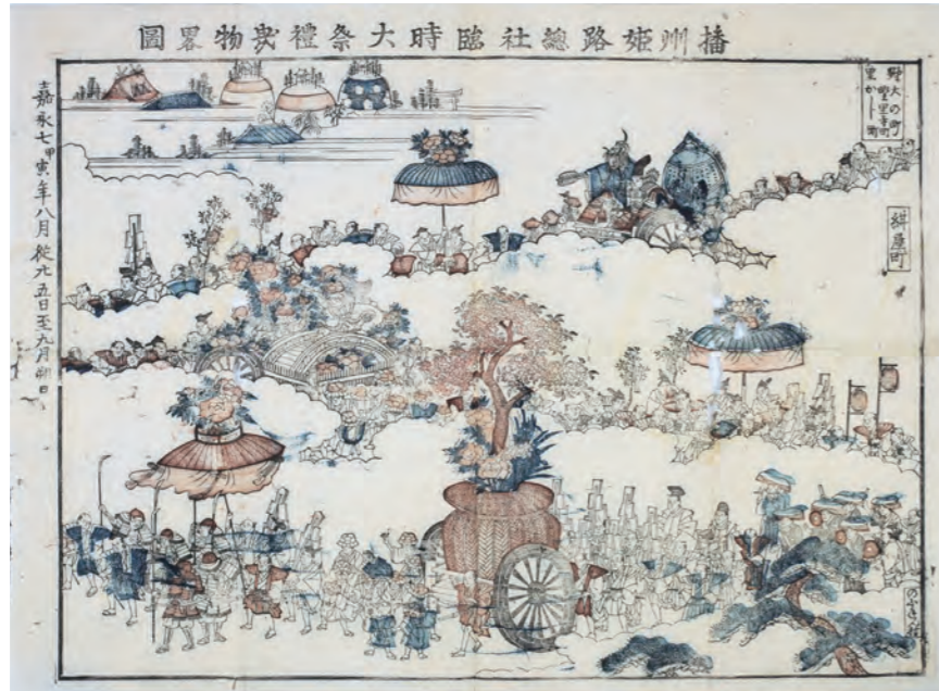
資料4 姫路城内総社臨時大祭礼略図 (前川憲司氏蔵)