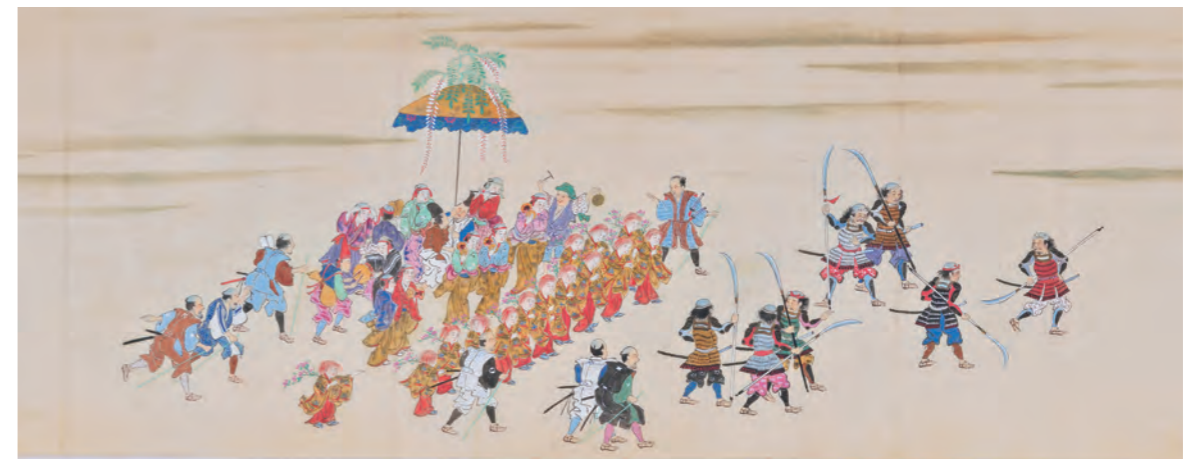
③西の山(小袖山)の謡囃子