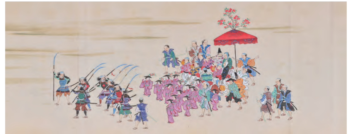
①東の山(二色山)の謡囃子